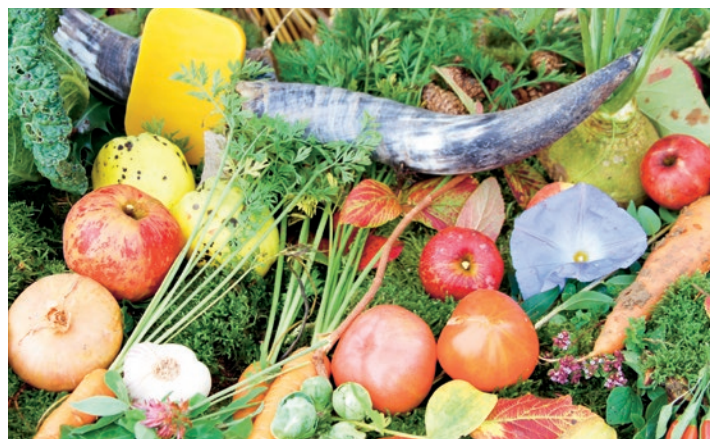
Erntedanktisch: Am Morgen Nüsslisalat pflanzen, mittags Suppe schmausen und am Nachmittag feiern – ein typischer Aktionstag bei biocò.